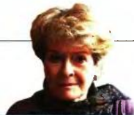
THE DAME JANET SUZMAN