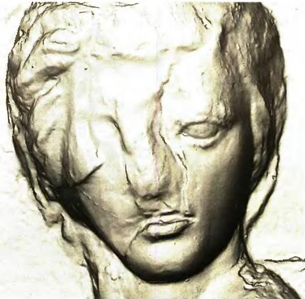
Τρισδιάστατο μοντέλο μορφής από τη δυτική ζωφόρο του Παρθενώνα. Αριστερά το πρωτότυπο γλυπτό, δεξιά το εκμαγείο του Ελγιν