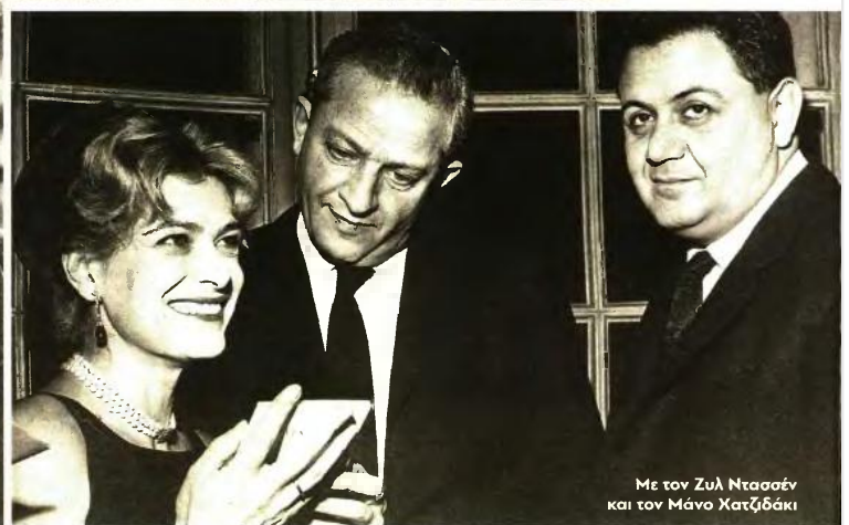
Με τον Ζυλ Ντασσέν και τον Μάνο Χατζιδάκι