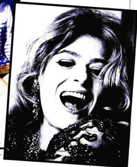
Η Μελίνα Μερκούρη (επάνω) και στις πρόβες για το Ilya Darling , Νέα Υόρκη, 1967 (αριστερά).