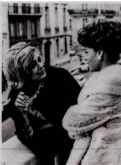
Με τη Ρόμι Σνάνιερ στο Παρίσι. Υπήρξαν φίλες και συμμητραιγωνίστριες στο «Δέκα και μισό, Καλοκαίρι βράδυ» του Ζύλ Ντασοσέν, που βασίστηκε σε μυθιστόρημα της Μαργκερίτ Νταράς.

Σε τρεις ενότητες (κινηματογράφος, θέατρο, ερμηνείες στο θέατρο, αγωνιστική και κοινοβουλευτική δράση) διαθρώνεται η έκθεση την οποία επιμελήθηκε