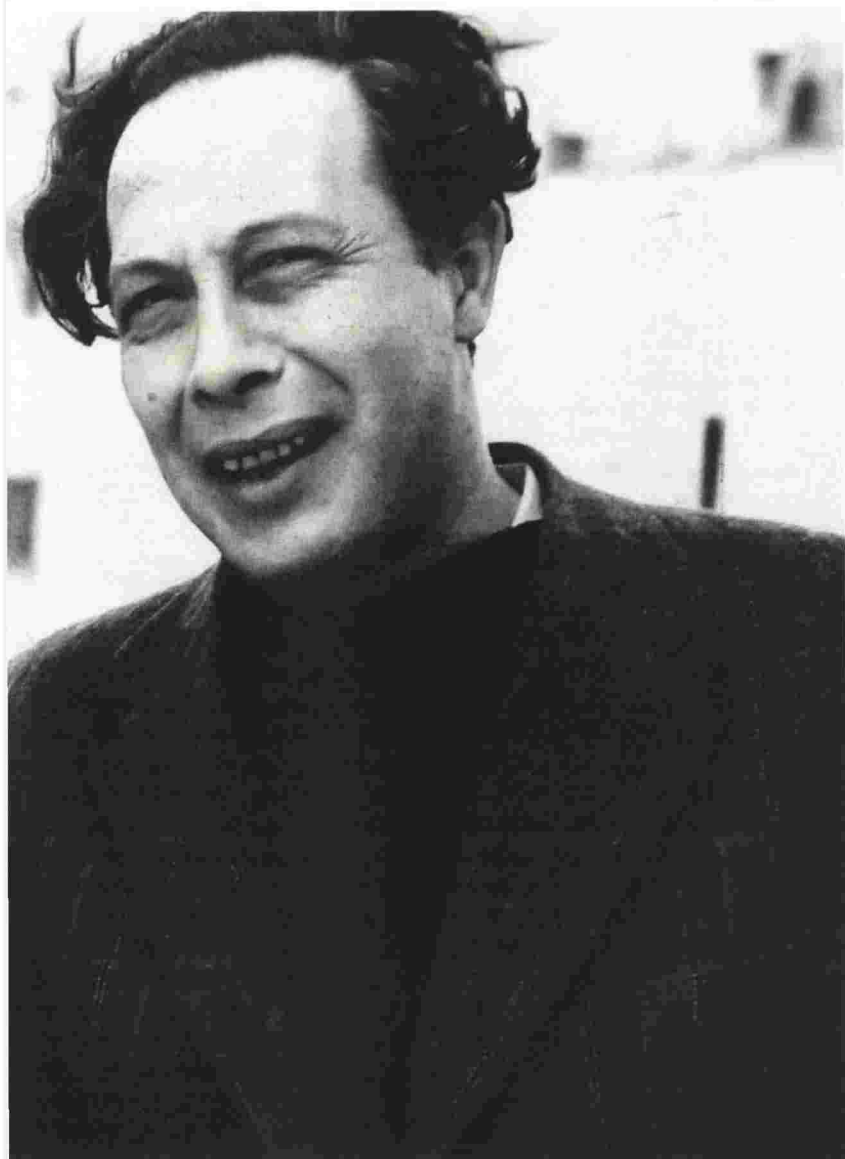
Η ΜΕΛΙΝΑ άρεσε στον Κουν και ως ηθοποιός και ως προσωπικότητα. Και η Μελίνα τον λάτρευε, και όταν έγινε υπουργός τον πρόσεξε σαν τα μάτια της

πολιτισμό μας το δεύτερο μισό του 20ού αιώνα και που θα πρέπει να μνημονεύονται εσαεί