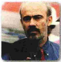
γράφει ο ΓΙΩΡΓΟΣ ΛΙΑΝΗΣ

Τα δύο «ιερά τέρατα» του θεάτρου μας που άφησαν ανεξίτηλο το στίγμα τους στον